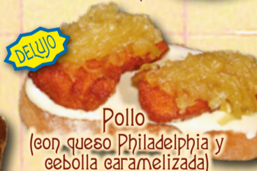
Pollo (con queso Philadelphia y cebolla caramelizada)