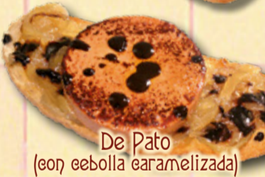
De Pato (con cebolla caramelizada)