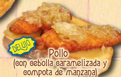
Pollo (con cebolla caramelizada y compota de manzana)