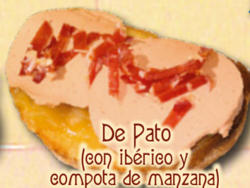
De Pato (con ibérico y compota de manzana)