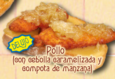
Pollo (con cebolla caramelizada y compota de manzana)