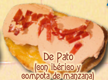
De Pato (con ibérico y compota de manzana)