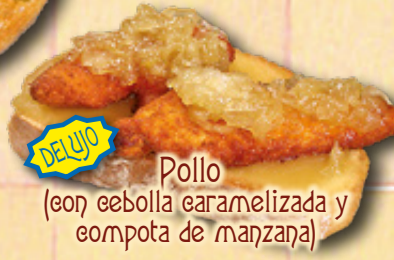
Pollo (con cebolla caramelizada y compota de manzana)