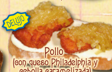
Pollo (con queso Philadelphia y cebolla caramelizada)