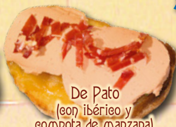
De Pato (con ibérico y compota de manzana)